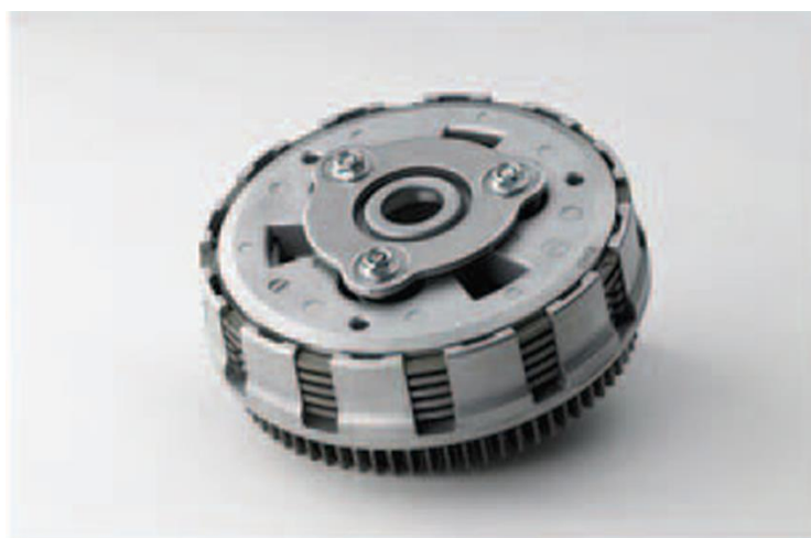
Frizione assistita standard Kawasaki